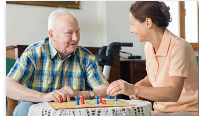
EIN STÜCK FLEXIBILITÄT