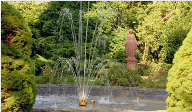
EIN STÜCK LEBENSQUALITÄT

Der Bahnhof ist nur wenige Fußminuten entfernt und gewährleistet eine problemlose Anbindung nach Saarbrücken.