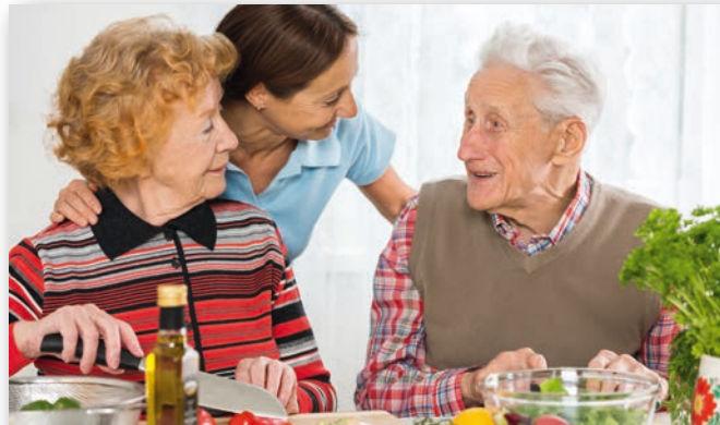
EIN STÜCK VERTRAUTHEIT

Wir schätzen auch die Kontakte zu unseren französischen Nachbarn.